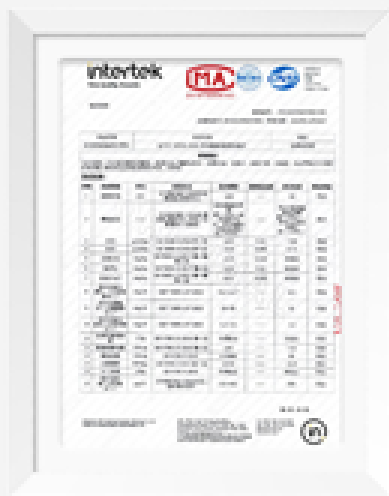
《多重第三方产品质量检测》